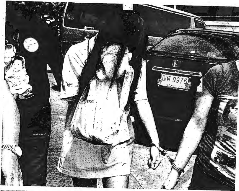
นอนคุก - ดำรงสน. โชคชัยคุ้มตัวสาวอายุ 19 ปี สงขลาอาญา ถ.รัชดาฯ เพื่อขอฝาก ขังคดีแรก ในคดีร่วมกับ 6 โจรม้าหนุ่มข่าพิการ ในซอยโชคชัย 4 ก่อนถูกส่งตัวเข้าเรือน จำ เนื่องจากไม่มีญาติมารับประกันตัว เมื่อวันที่ 8 พ.ค.