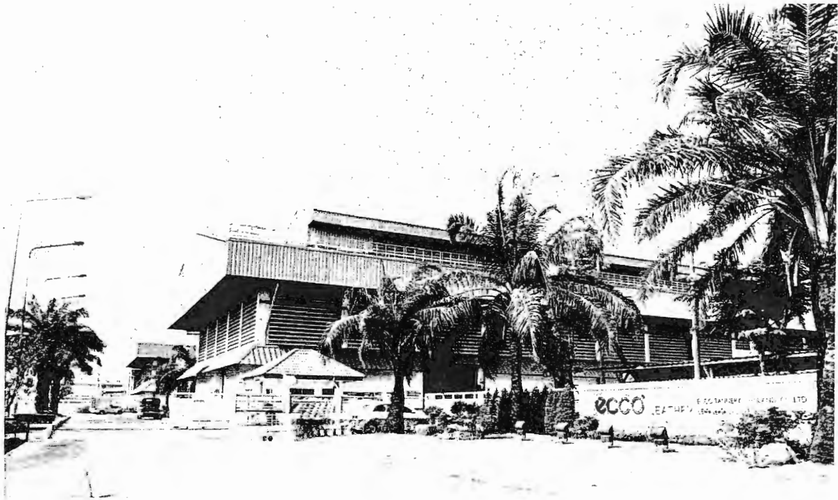
สหรัตนฯ ใกล้เคียง - แม้จะผ่านการปรับโครงสร้างหนี้มาแล้ว แต่ภาพรวมทางการเงินของบริษัท สหรัตนนคร จำกัด ไม่ได้ดีขึ้น จนกระทั่งเจ้าหน้าที่รายใหญ่ยื่นร้องต่อศาลล้มละลายกลาง รวมถึงการนิคมอุตสาหกรรมแห่งประเทศไทย ขอยกเลิกสัญญาร่วมดำเนินการ และขอเข้าบริหารแทน

กลับมาชี้แจงในวันที่ 27 เมษายนนี้ คาดว่า จะพิจารณาตัดสินในวันนั้นเช่นกัน ซึ่ง กนอ.เตรียมที่จะชี้แจงต่อผู้ประกอบการ ในพื้นที่นิคมอุตสาหกรรมสหรัตนฯ ที่มี อยู่ประมาณ 20 รายต่อไป