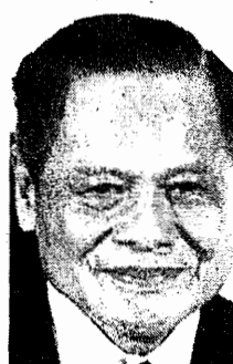
บรรหาร ศิลปอาชา