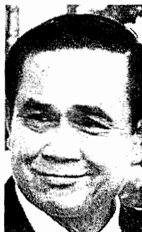
พล.อ.ประยุทธ์ จันทร์โอชา