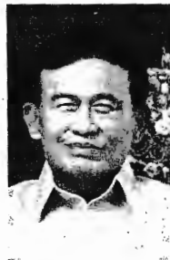
พล.อ.ไพบูลย์ คุ่มฉายา