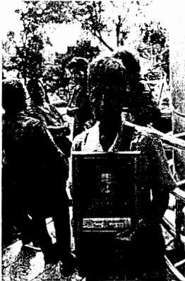
ญาติเหยื่อ 99 ศพ

โดยเมื่อวันที่ 18 เมษายน 2553 จำเลยทั้งสอง มีคำสั่งให้เจ้าหน้าที่ศอน. สามารถใช้อาวุธปืนและกระสุนปืนจริงในการปฏิบัติหน้าที่ได้ ต่อจากนั้นเมื่อคำสั่งมาตรการปิดล้อมสกัดกั้นขอคืนพื้นที่บริเวณสวนลุมพินี และพื้นที่ต่อเนื่อง