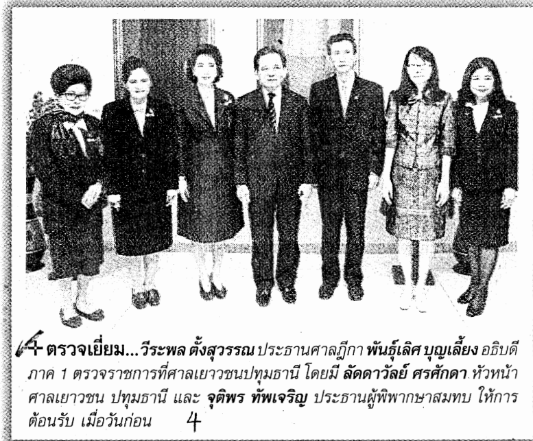
4- ตรวจเยี่ยม... วีระพล ตั้งสุวรรณ ประธานศาลฎีกา พันธุ์เลิศ บุญเลี้ยง อธิบดี ภาค 1 ตรวจราชการที่ศาลเยาวชนปทุมธานี โดยมี ลัดดาวัลย์ ศรีศักดิ์ หัวหน้า ศาลเยาวชน ปทุมธานี และ จุติพร ทัพเจริญ ประธานผู้พิพากษาสภมทบ ให้การ ต้อนรับ เมื่อวันก่อน 4