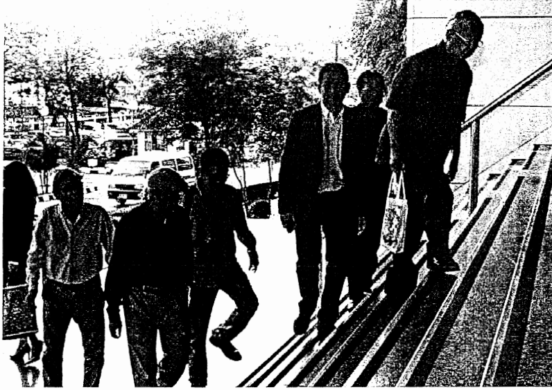
ยึดยาว - แกนนำและแนวร่วมพันธมิตรฯ รวม 97 คน เดินทางมาขึ้นศาล เพื่อนัดตรวจ พยานในคดีปิดสนามบินดอนเมืองและสนามบินสุวรรณภูมิ เมื่อปี 2551 โดยศาลนัดสืบ พยานโจทก์นัดแรกวันที่ 20 ต.ค. 2559 ที่ศาลอาญา รัชดาฯ เมื่อวันที่ 1 ก.พ.