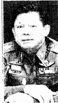
พล.ต.อ.พงศ์พัศ พงษ์เจริญ