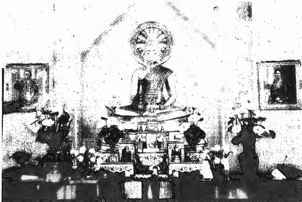
พระประธาน "หลวงพ่อพระพุทธโสธรจำลอง" พร้อมพระบรมฉายาลักษณ์ของสมเด็จพระสังฆราชและสมเด็จพระอริยวงศาคตญาณ สมเด็จพระสังฆราช สกลมหาสังฆปริณายก