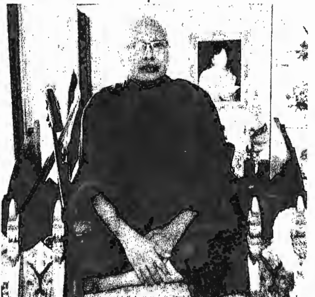
เจ้าอาวาสและพระสงฆ์จากวัดไผ่เหลือง นำสวดมนต์ก่อนจะประกอบพิธีเวียนเทียนถวาย เป็นพุทธบูชา เนื่องในวันอาสาฬหบูชา และเข้าพรรษา