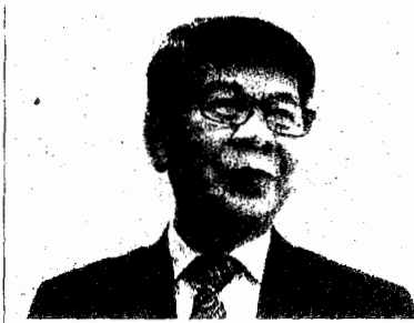
สมนึก เสียงก้อง

โดยเมื่อวันที่ 29 ส.ค.2559 พนักงานอัยการสำนักงานคดีพิเศษ 1 ได้รับหนังสือจากอธิบดีกรมสอบสวนคดีพิเศษ