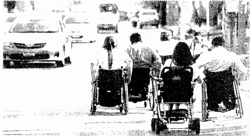
ชาวคนพิการฟ้องกรุงเทพมหานคร

ท่ามกลางข่าวดี! และความภาคภูมิใจที่เกิดขึ้นก็ปรากฏข่าวในเชิงลบ (จริง ๆ) กับกรุงเทพมหานครเหมือนกรรมติดจรวดเช่นเดียวกันนั่นก็คือ ชาวคนพิการฟ้องกรุงเทพมหานครนั่นเอง โดยเนื้อหาระบุว่า