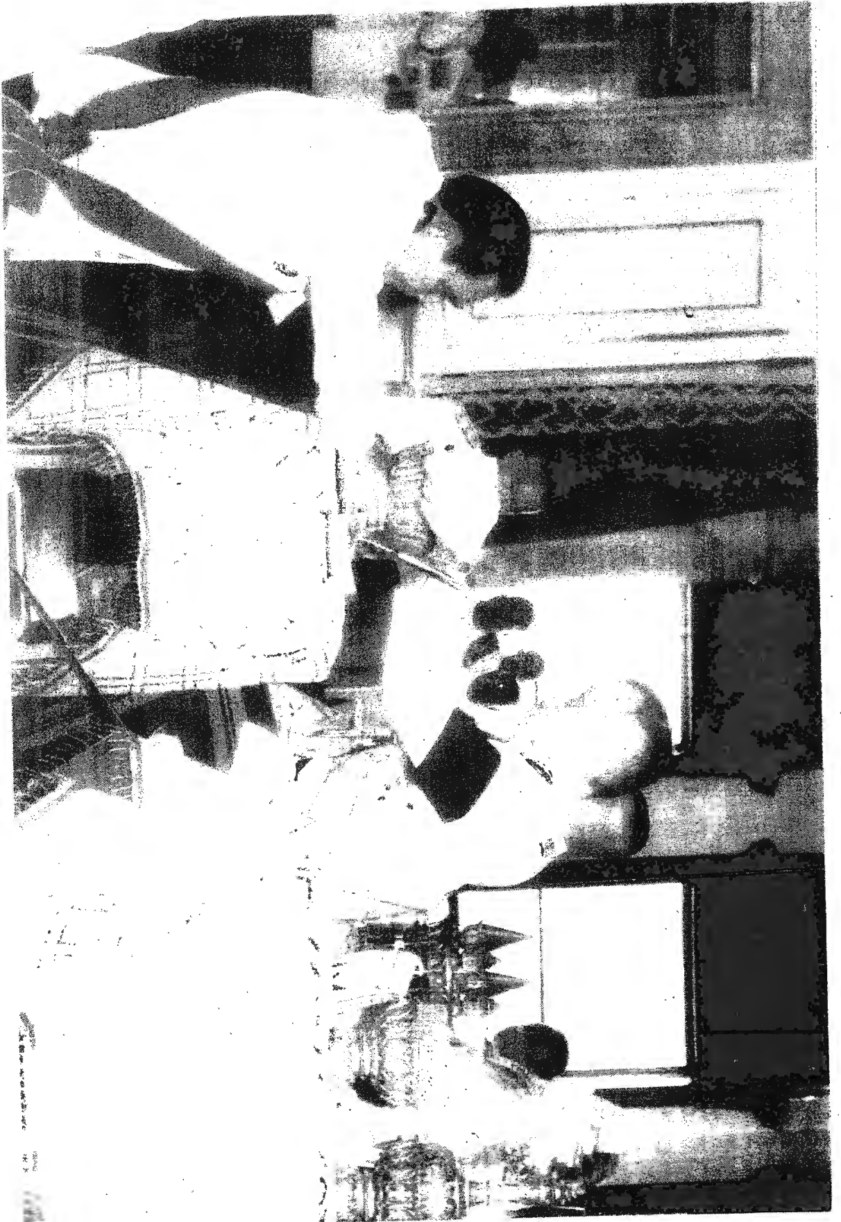
สมเด็จพระเจ้าอยู่หัว เสด็จพระราชดำเนินไปเฝ้าทูลละอองธุลีพระบาทสมเด็จพระนางเจ้ารำไพพรรณีฯ แห่งราชอาณาจักรไทย พุทธศักราช 2560 ณ พระที่นั่งอัมรินทร์สมาคม พระราชวังดุสิต วันพฤหัสบดีที่ 6 เมษายน 2560 เวลา 15.00 น.