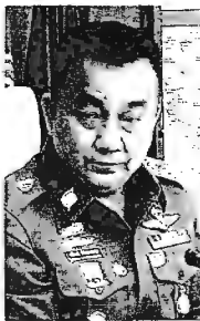
พ.ต.อ.ศรวิวัฒน์ รังสิพราหมณกุล