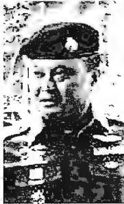
พ.ต.ต.กรไชย คล้ายคลึง