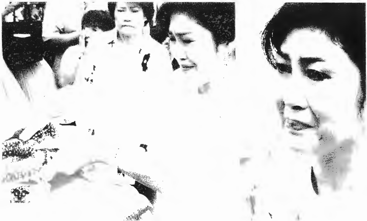
ครบ 50 ปี - น.ส.ยิ่งลักษณ์ ชินวัตร อดีตนายกรัฐมนตรี เดินทาง ทำบุญเนื่องในวันคล้ายวันเกิดปีที่ 50 ที่วัดสระเกศ พร้อมกับหลังน้ำตา ขณะให้สัมภาษณ์ถึงปัญหาอุปสรรคที่กำลังเผชิญหน้าอยู่ เมื่อวันที่ 21 มิถุนายน