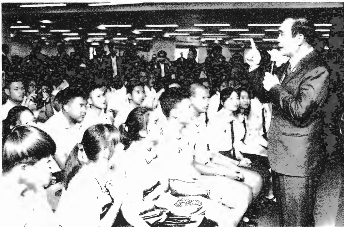
ทักษาย - พล.อ.ประยุทธ์ จันทร์โอชา นายกรัฐมนตรี กล่าวปาฐกถาพิเศษ “การ ขับเคลื่อนไทยแลนด์ 4.0 ในภาคตะวันออกเฉียง เหนือ” โดยมีคณะอาจารย์ และนักเรียนกว่า 2 พันคน ร่วมรับฟัง ณ ศูนย์ประชุม อเนกประสงค์กาญจนา ภิเษก ม.ขอนแก่น เมื่อวันที่ 21 มิถุนายน