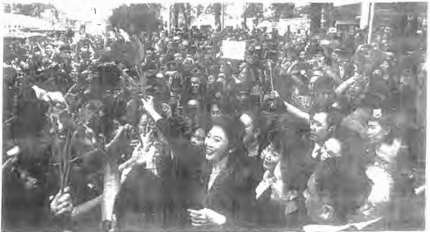
แถลงปิดคดี : นางสาวยิ่งลักษณ์ ชินวัตร เดินทางมาศาลฎีกาแผนกคดีอาญาของผู้ดำรงตำแหน่งทางการเมือง โดยมีมวลชนมาให้กำลังใจเป็นจำนวนมาก

กรุงเทพธุรกิจ ● “ยิ่งลักษณ์” แถลงปิดคดี จำนำข้าว 1 ชั่วโมงเต็ม ไร่ให้ขอยกฟ้องจำนำข้าว เหตุกระบวนการกล่าวหาผิดชอบ ยืนยันเจตนาทำ เพื่อช่วยชาวนาและเป็นไปตามการแถลงนโยบาย ต่อสภาฯ ขณะที่บรรดากองเชียร์ชุมนุมสงบ