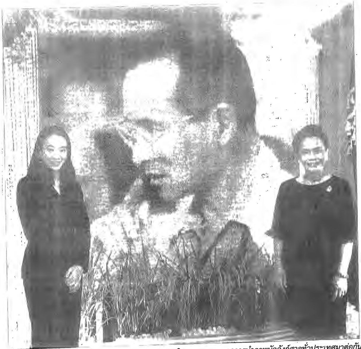
พระบรมฉายาลักษณ์พระบาทสมเด็จพระปรมินทรมหาภูมิพลอดุลยเดช จากการนำภาพบัลลังก์ศาลทั่วประเทศมาต่อกัน