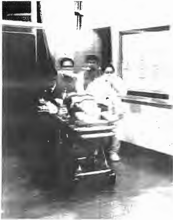
วงจรปิดพิสูจน