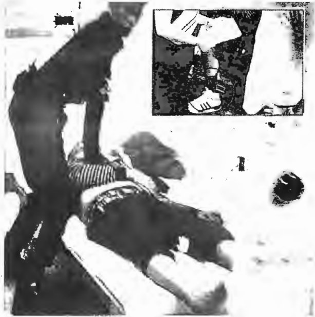
ยื้อชีวิตวันเกิดเหตุ

อยากให้พนักงานสอบสวนและศาลนำสำนวนการสอบสวนของกระทรวงยุติธรรมไปใช้ในคดีด้วยเนื่องจากการสอบสวนไว้หมดแล้ว หากพนักงานสอบสวนต้องการร้องขอให้สอบสวนเพิ่มเติมทาง