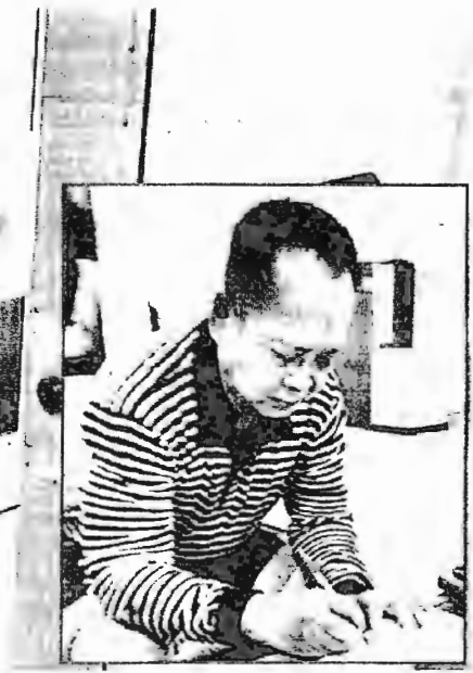
ห้องขังดีเอสไอ

ภาคแพร่ข่าวบริเวณห้อง 3 แห่ง ซึ่งเกิดก่อนที่ผู้ตายจะถึงแก่ความตาย เกิดจากของแข็งไม่มีคมกระแทก ซึ่งจะมีผลทำให้ผู้ตายมีอาการเจ็บชูกอย่างมาก