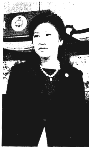
△ ยิ่งลักษณ์ ชินวัตร

ก่อนที่จะมีการระดมพลครั้งใหญ่ วันที่ 25 สิงหาคม ซึ่งนอกจากจะเป็น วันชี้ชะตา น.ส.ยิ่งลักษณ์ ชินวัตร แล้ว ยัง เป็นวันที่ประวัติศาสตร์การเมืองไทยจะถูก “บันทึก” ไว้ด้วยว่า น.ส.ยิ่งลักษณ์ เป็น อดีตนายกรัฐมนตรีหญิงคนแรกของ ประเทศไทยที่ได้รับโทษและชดใช้ความผิด จากความเสียหาย หลังจาก “พี่ชาย” คือ นายทักษิณ ชินวัตร เป็นอดีตนายก รัฐมนตรีชายคนแรกที่ถูกตัดสินในความผิดคดีทุจริต...แต่ซึ่งหนีออกนอกประเทศ ไปก่อนที่จะได้รับโทษ??!