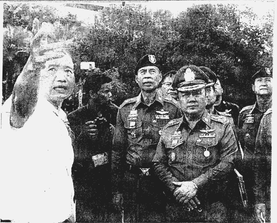
< ความพร้อม > พล.ต.อ.ศรีวราห์ รังสิ- พราหมณกุล รอง ผบ.ตร. นำคณะเดินตรวจสอบ สภาพกล้องวงจรปิดที่ติด ตั้งเพิ่มรวมกว่า 120 ตัว รอบๆ บริเวณศาลฎีกาแผนกคดี อาญาฯ พร้อมรับวันดี หังคำพิพากษาคดีรับจำนำ ข้าว วันที่ 25 ส.ค.