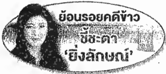
ย้อนรอยคดีข่าว ชัชชาติ 'ยิ่งลักษณ์'

กรุงเทพธุรกิจ • ในวันนี้ (25 ส.ค.) ในช่วงเวลา 09.00 น. จะเป็นนัดหมายฟังคำพิพากษา ในคดีที่ย้ายการสูงสุด ยื่นฟ้องนางสาวยิ่งลักษณ์ ชินวัตร อดีตนายกรัฐมนตรี เป็นจำเลยในความผิดฐานเป็นเจ้าพนักงานปฏิบัติหน้าที่หรือละเว้นการปฏิบัติหน้าที่โดยมิชอบและโดยทุจริตเพื่อให้เกิดความเสียหายแก่ผู้หนึ่งผู้ใด ตามประมวลกฎหมายอาญามาตรา 157 และเป็นเจ้าหน้าที่ของรัฐปฏิบัติหรือละเว้นการปฏิบัติอย่างใดในตำแหน่งหรือหน้าที่หรือใช้อำนาจในตำแหน่งหรือหน้าที่โดยมิชอบ เพื่อให้เกิดความเสียหายแก่ผู้หนึ่งผู้ใดหรือปฏิบัติหรือละเว้นการปฏิบัติหน้าที่โดยทุจริต ตามพระราชบัญญัติ(พ.ร.บ.)ป้องกันและปราบปรามทุจริตแห่งชาติ จากกรณีปล่อยปลละละเลยไม่ยับยั้งโครงการจำนำข้าว กับอีกคดีหนึ่ง คือคดีที่ย้ายการสูงสุดเป็นโจทก์ยื่นฟ้อง นายบุญทรง เจริยาภิรมย์ อดีตรัฐมนตรีว่าการกระทรวงพาณิชย์ กับพวกรวม 28 คน เป็นจำเลย ในความผิดตามพ.ร.บ.ว่าด้วยความผิดเกี่ยวกับการเสนอราคาต่อหน่วยงานรัฐ (ฮั้วประมูล) พ.ศ.2542, ฐานเป็นเจ้าพนักงานมีหน้าที่ซื้อ จัดการหรือรักษาทรัพย์ ใช้อำนาจโดยทุจริตสร้างความเสียหายแก่รัฐ ตามมาตรา 151 และ ฐานเป็นเจ้าพนักงานปฏิบัติหน้าที่หรือละเว้นการปฏิบัติหน้าที่โดยมิชอบหรือโดยทุจริตสร้างความเสียหายแก่ผู้หนึ่งผู้ใด ตามมาตรา 157 ประมวลกฎหมายอาญาและ พ.ร.บ.ว่าด้วยการป้องกันและปราบปรามการทุจริต พ.ศ.2542 ทั้งสองคดีนี้นัดฟังคำพิพากษาวັນเดียวกัน