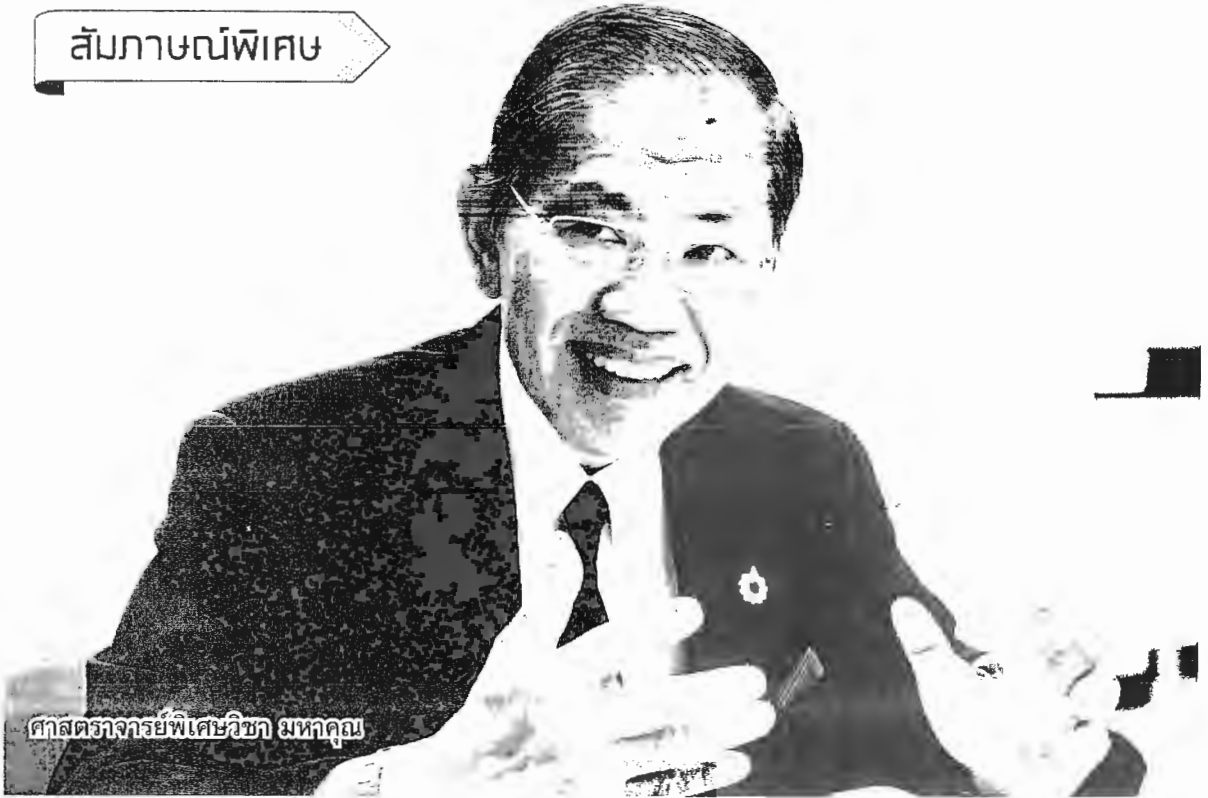
ศาสตราจารย์พิเศษวิชา มหาคุณ

รับสารภาพ ผู้พิพากษาจึงไม่ได้ซักถาม อาจารย์สัญญาจึงรับใส่เกล้าฯ มาบอกกับผู้พิพากษาว่า เมื่อผู้พิพากษาอยู่บนบัลลังก์ ให้ซักไซ้ไล่เรียง เพราะถ้าเป็นคดีที่มีโทษร้ายแรง โดยมากจะไปถึงพระเนตรพระกรรณ ขอพระราชทานอภัยโทษ เพราะฉะนั้นอย่างสร้างความหนักพระราชหฤทัยให้กับพระบาทสมเด็จพระเจ้าอยู่หัว และต้องมีข้อมูลให้พระองค์ท่านใช้ดุลยพินิจเพื่อลดหย่อนผ่อนโทษ