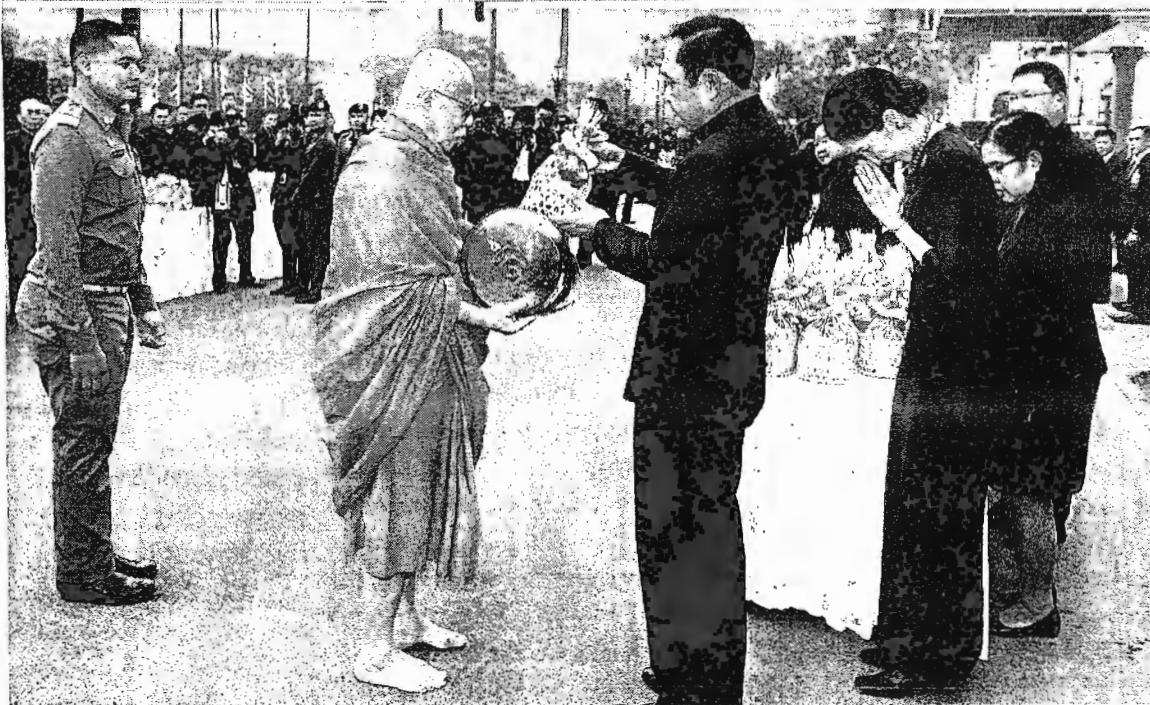
▲ ตักบาตร... พล.อ. ประยุทธ์ จันทร์โอชา นายกรัฐมนตรี และภริยา ร่วมตักบาตรพระสงฆ์ 89 รูป พร้อมกับเหล่าข้าราชการ ที่บริเวณทำเนียบรัฐบาล เพื่อถวายเป็นพระราชกุศล ครบ 1 ปี วันสวรรคตพระบาทสมเด็จพระปรมินทรมหาภูมิพลอดุลยเดช