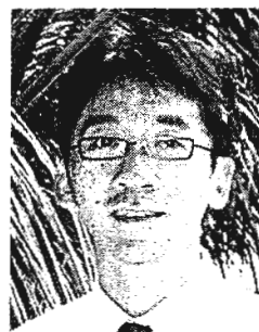
ผศ.ดร.ปริญญา

คณะนิติศาสตร์มหาวิทยาลัยธรรมศาสตร์และตัวแทนเครือข่าย มองว่า ตั้งแต่อดีตตามรัฐธรรมนูญ 2492 จนถึงขณะนี้มีการให้คำรับรองว่าบุคคลถือเป็นผู้บริสุทธิ์จนกว่าจะมีคำพิพากษาของศาลแต่สภาพความเป็นจริงมีการคุมขังผู้ที่อยู่ระหว่างพิจารณาคดีเช่นเดียวกับผู้ต้องขังอื่นในประเทศไทยถือเป็นประเทศที่มีผู้ต้องขังล้นเรือนจำติดอันดับ 14 ของโลก ในจำนวนกว่า 3 แสนคน เมื่อจำแนกออกมาจะเป็นผู้ต้องขังระหว่างพิจารณามากถึง 68,000 คน