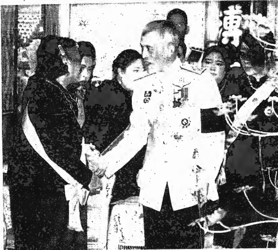
สมเด็จพระเจ้าอยู่หัว มีพระราช ปฏิสันถารกับสมเด็จพระเทพรัตนราช สุดาฯ สยามบรมราชกุมารี ขณะเสด็จฯ ในการพระราชพิธีทรงบำเพ็ญพระราชกุศล