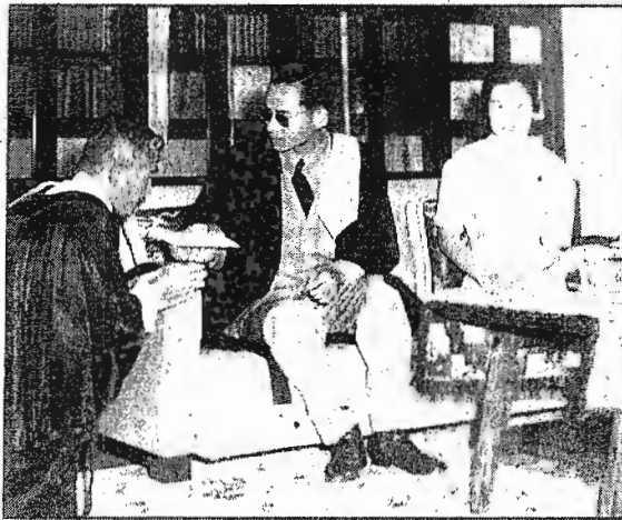
พระบาทสมเด็จพระปรมินทรมหาภูมิพลอดุลยเดช รัชกาลที่ 9 ทรงตัดสินคดีด้วยพระองค์เองเป็นครั้งแรกในวันที่ 26 มกราคม 2495 คดีแรกที่พระองค์ทรงตัดสินคือ "คดีลักไม้"

ตลอดรัชกาลทั้งการบอกเล่า สิ่งที่ได้รับรู้ผ่านทางสายตา ไปจนถึงหากมีโอกาสสักแว่บจะพบข้อเท็จจริงหนึ่งที่ปรากฏออกมาให้เห็นเด่นชัดคือ ภาพการเสด็จพระราชดำเนินไปทั่วทุกหัวระแหง โดยเฉพาะในที่ห่างไกลความเจริญ บาง