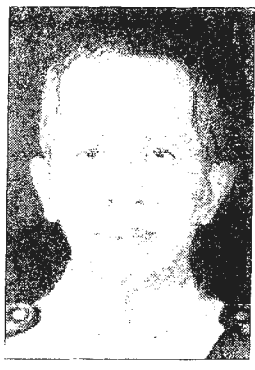
ชีพ จุลมนต์

อย่างไรก็ตาม ตามกฎหมายเปิดช่องให้นอกจากการประกาศรับสมัครแล้ว ให้คณะกรรมการสรรหาดำเนินการสรรหาจากบุคคลซึ่งมีความเหมาะสมทั่วไปได้ด้วย แต่ต้องได้รับความยินยอมจากบุคคลนั้น ทั้งนี้ โดยคำนึงถึงความหลากหลายของประสบการณ์ที่แตกต่างกันในแต่ละด้าน ประกอบด้วย และเพื่อประโยชน์แห่งการนี้ กฎหมายเขียนไว้ว่าให้นำหลักเกณฑ์มาใช้บังคับแก่การคัดเลือกผู้สมควรได้รับแต่งตั้งเป็นกรรมการของที่ประชุมใหญ่ศาลฎีกาด้วยโดยอนุโลม ขณะที่ในขั้นตอนการสรรหาหรือคัดเลือกของกรรมการสรรหาให้ใช้วิธีลงคะแนนโดยเปิดเผยและให้กรรมการสรรหาแต่ละคนบันทึกเหตุผลในการเลือกไว้ด้วย ผู้ซึ่งจะได้รับการสรรหาต้องได้รับคะแนนเสียงถึงสองในสามของจำนวนทั้งหมดเท่าที่มีอยู่ของคณะกรรมการสรรหา