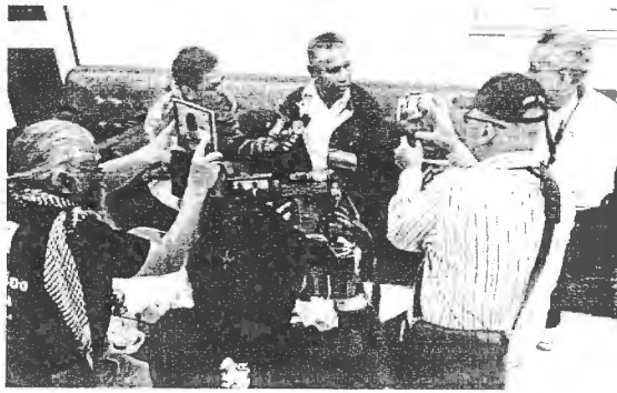
ลับ วาปี รั้งบุดจ้ง

ชั้นศาล จึงมองว่าเป็นการหลีกเลี่ยงการซักค้านของอัยการ