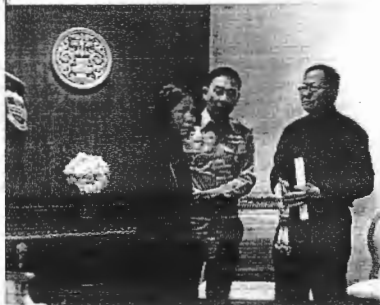
ฟัง ยศ. รื้อคดี