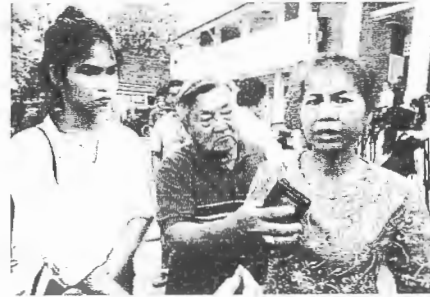
ฟังคำพิพากษา