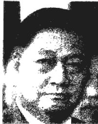
Sukumpol: 'Meted out persecution'