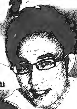
กาน้ำ อภิคุณาวาจา