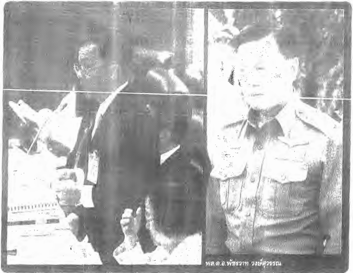
พล.ต.อ.พัชรวาท วงษ์สุวรรณ

เข้าไปเจ้าหน้าที่ทาง การแพทย์และรถพยาบาล และการสลาย การชุมนุมได้ใช้แก๊สน้ำตาที่ขัดต่ออายุการใช้งาน