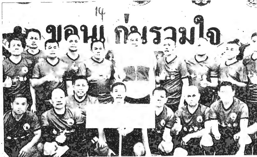
ฟุตบอลลีเกิ้ล...พล.ต.ท.สุรชัย ควรวุฒิชัย ผบ.ภ.4 นำทีมข้าราชการตำรวจในสังกัดตำรวจภูธรภาค 4 ร่วมแข่งขันฟุตบอลลีเกิ้ล "ขอนแก่นร่วมใจ" โดยมีทีมปกครอง ทีมศาลยุติธรรม ทีมทหารและทีมตำรวจ ร่วมแข่งขันเพื่อกระชับความสัมพันธ์อันดี ณ สนามฟุตบอล โรงเรียนแก่นนครวิทยาลัย จ.ขอนแก่น