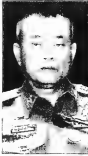
พล.ต.ท.ฐิติราช หนองหารพิทักษ์