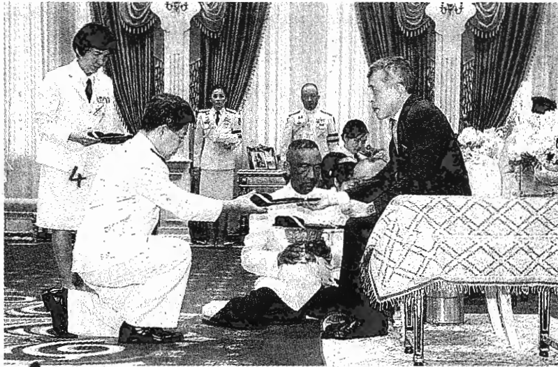
สมเด็จพระเจ้าอยู่หัว พระราชทานพระราชวโรกาสให้ ชีพ จุลมนต์ ประธานศาลฎีกา พร้อมคณะผู้บริหารและข้าราชการศาลยุติธรรม นำผู้สำเร็จการอบรมหลักสูตรผู้บริหารกระบวนการยุติธรรมระดับสูง (บ.ย.ส.) รุ่นที่ 21 เข้าเฝ้าฯ รับพระราชทานอนุฉิมบัตร เข็มวิทย์ฐานะ และรับพระราชทานพระราโชวาท ณ พระที่นั่งอัมพรสถาน พระราชวังดุสิต