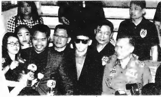
เบนซ์ เรซซิ่ง

ติดต่อกับพวกเรื่องขยาเสพติด และการโอนเงินเชื่อมโยงเป็นเครือข่าย ติดต่อกับขบวนการค้ายาหลายกลุ่ม โดยในชั้นสอบสวนจำเลยรับสารภาพตลอดข้อกล่าวหา