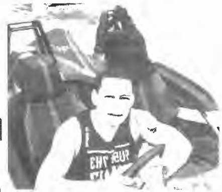
ชีวิตทรูหรา