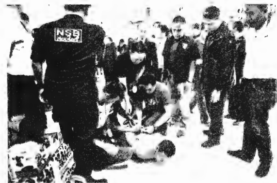
จับคาสวรรณภูมิ

เมื่อตรวจสอบเบอร์โทรศัพท์ และไลน์ของจำเลย ก็พบว่ามีการ