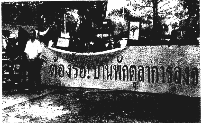
Members of the Network to Reclaim Doi Suthep Forest gather at Kawila Military Camp in Chiang Mai province yesterday to demand that court buildings and residences be cleared from Doi Suthep Mountain.

The construction, including Appeals Court Region 5 buildings and court officials' residences, is also seen as a threat to the local environment and ecology.