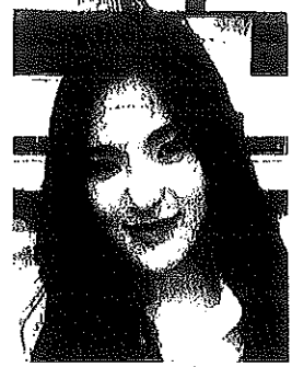
สุทัตตา อุดมศิลป์

ความผิดฐาน “ตัวการร่วม” เป็นความผิดตาม พ.ร.บ.เครื่องสำอาง พ.ศ. 2558 และ พ.ร.บ.อาหารและยา พ.ศ. 2522 .. แม้จะมีโทษไม่แรง แต่ก็ถือเป็น “บทเรียนสำคัญ” (อีกครั้ง) ของศิลปิน-ดารา ในฐานะ “บุคคลสาธารณะ” ซึ่งครั้งหนึ่ง ก็เคยติดบ่วงโฆษณาเครื่องสำอางปลอมมาแล้ว ..