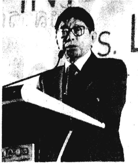
ศ.กิตติคุณ วิษณุ เครืองาม รองนายกรัฐมนตรี เป็นประธานเปิดการสัมมนาและปาฐกถาพิเศษ