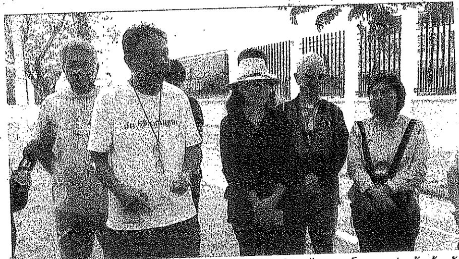
เครือข่ายภาคประชาชน แกลงขบวนถึงกรณีที่ไม่ได้รับอนุญาตให้เข้าไปสำรวจโครงการก่อสร้างบ้านพักข้าราชการตุลาการศาลอุทธรณ์ภาค 5 เชียงดอยสุเทพ ตำบลดอนแก้ว อำเภอแม่ริม จังหวัดเชียงใหม่ วานนี้ (12 มิ.ย.)