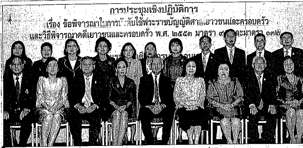
แวดวงกฎหมาย : ชีพ จุลมนต์ ประธานศาลฎีกา เปิดการประชุมเรื่อง “ข้อเสนอแนะในการบังคับใช้พระราชบัญญัติศาลเยาวชนและครอบครัว และวิธีพิจารณาคดีเยาวชนและครอบครัว พ.ศ.2553 มาตรา 90 และมาตรา 132” โดยมี บุญมี ฐิตะศิริ ประธานแผนกคดีเยาวชนและครอบครัวในศาลฎีกา และ เมทินี ชโลธร ประธานศาลอุทธรณ์คดีชำนัญพิเศษ ร่วมประชุม ที่โรงแรมมิราเคิล แกรนด์ คอนเวนชั่น