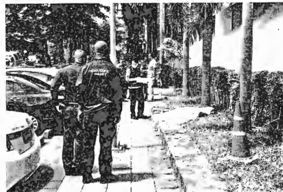
โหดตึกศาล