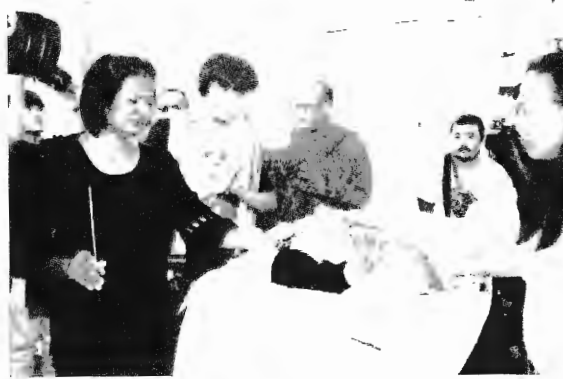
เมื่อยรับศพ

แต่แล้วก็ทราบว่าสามีกระโดดลงจากตึกฆ่าตัวตาย พริบตานั้นก็คิดจะกระโดดตึกฆ่าตัวตายบ้าง แต่มีคนดึงเอาไว้ทัน