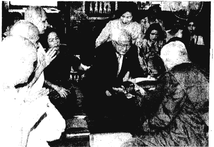
ชาติชาย โยษิตวัฒน์ฤกษ์ อธิบดินคผู้พิพากษาศาลเขวชนและครอบครัวกลาง ประทานในพิธี ฝ่ายฆราวาส ถวายผ้าไตรแก่ประธานในพิธีสงฆ์