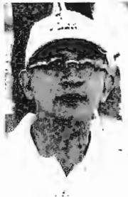
ชีพ จุลมนต์