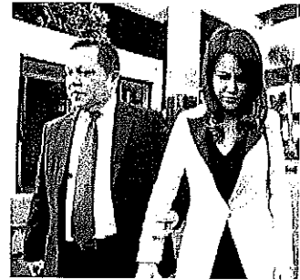
ศาลยกฟ้อง