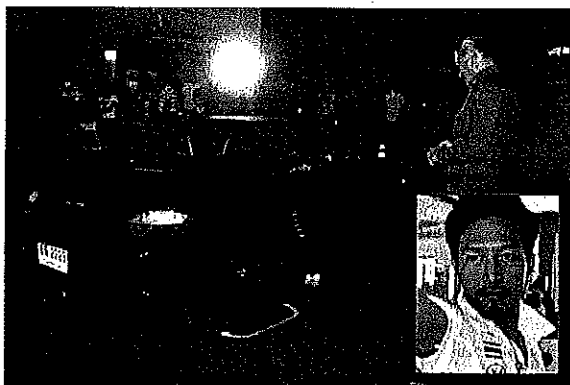
ยิวเอ็กซ์คาปอร์เซ่

หลายหน เชื่อว่าผู้ตายไม่สามารถแก้ไขพฤติกรรมได้ น.ส.สุรางค์จึงมีความผิดฐานใช้จิ้งจวนฆ่า