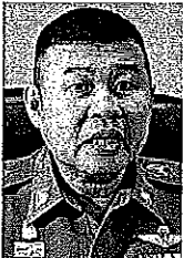
พล.ต.ท.ดำรงศักดิ์ กิตติประภัสร์

เงินเกือบ 800 ล้าน จ่อหมายจับพ่อมดตลาดหุ้น เห็นลางๆ เส้นทางการเงินโยงโยอินให้กัน 21 ล้าน... ● ตำรวจ ปคม.โชว์ผลงานหลายค้ำกามออนไลน์ เด็กชายต่ำกว่า 18 ปี ช่วยเหลือเหยื่อได้ 8 ราย