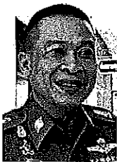
พล.ต.ต.โมตรี ฉิมฉิด