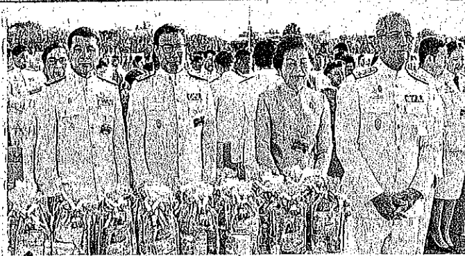
10 ถวายพระราชกุศล จีพ. จุฬอนันต์ ประธานศาลฎีกาและผู้บริหาร ศาลยุติธรรม ร่วมพิธีทำบุญตักบาตรข้าวสารอาหารแห้งแด่พระภิกษุสงฆ์และ สามเณร 248 รูป ถวายเป็นพระราชกุศลเนื่องในงานเฉลิมพระชนมพรรษา สมเด็จพระนางเจ้าสิริกิติ์ พระบรมราชินีนาถ ที่สนามหลวง