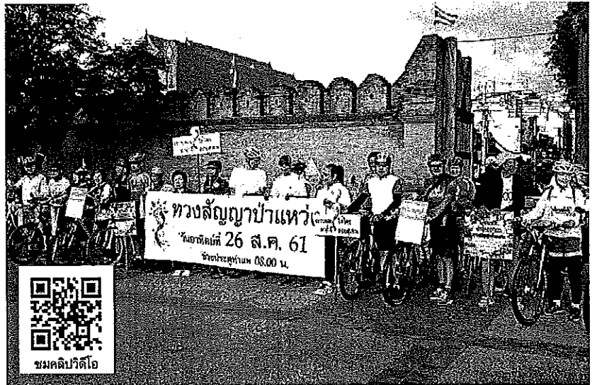
ทางคืน - เครือข่ายขอคืนพื้นที่ป่าดอยสุเทพ พร้อมด้วยกลุ่มชมรมจักรยานจังหวัดเชียงใหม่ ร่วมกันปั่นจักรยานรณรงค์และติดริบบิ้นสีเขียว เชิญชวนให้ประชาชนชาวเชียงใหม่ออกมาร่วมกันขับเคลื่อนทางคืนผืนป่าดอยสุเทพกลับคืนในเวลา 08.00 น. วันที่ 26 สิงหาคม ที่ลานประตูท่าแพ เมื่อวันที่ 19 สิงหาคม

“อยากขอให้ทางรัฐบาลเร่งดำเนินการให้เร็วที่สุด เพื่อให้คนเชียงใหม่สบายใจว่าจะมีการส่งมอบพื้นที่คืนให้กับทางกรมธนารักษ์ และจะได้เข้าไปฟื้นฟูป่าดอยสุเทพให้กลับคืนมาตามความตั้งใจและเป็นวัตถุประสงค์หลักของการทางคืนผืนป่าดอยสุเทพ แต่หากไม่มีการส่งมอบจะทำให้การฟื้นฟูล่าช้า ทางรัฐบาลก็ไม่ควรจะยื้อระยะเวลาในการส่งมอบพื้นที่ และการรื้อถอนเพื่อการฟื้นฟูป่า” นายธีระศักดิ์กล่าว