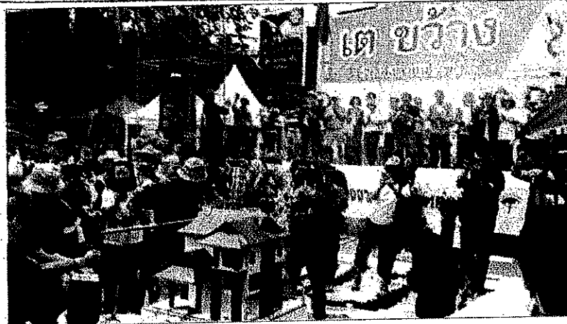
กลุ่มเครือข่ายขอคืนพื้นที่ป่าดอยสุเทพ จัดกิจกรรม "รวมพลังหัวใจสีเขียว ทวงสัญญาป่าแห่ง" เพื่อทวงสัญญาจากรัฐบาล ให้รื้อบ้านพักข้าราชการตุลาการศาลอุทธรณ์ ภาค 5 บนพื้นที่ป่าเชิงดอยสุเทพ โดยมีการ อ่านบทสาปแช่งตามบันไดถ้ำล้านนาโบราณ พร้อมเผาพริก เผาเกลือ และ เผาแบบจำลองบ้านพักฯ ที่บริเวณลานประตูท่าแพ จ.เชียงใหม่ เมื่อวันที่ (26ส.ค.)