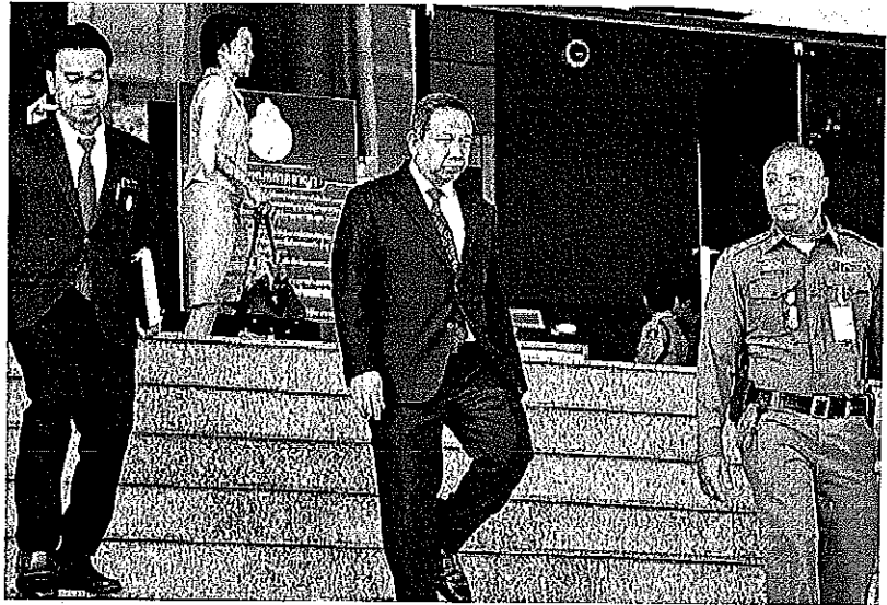
ยกฟ้อง - นายธาวี ต.เพ็งคินธุ์ อดีตอธิบดีดีเอสไอ เดินทางออกจากศาลอาญา หลังศาลยกฟ้องคดีที่ถูก นายอภิสิทธิ์ เวชชาชีวะ อดีตนายกฯ และนายสุเทพ เทือกสุบรรณ อดีตรองนายกฯ ฟ้องว่าบุกรุกที่ดินที่มี ขอบกรณีแจ้งข้อหาด้วยกันผู้อื่น ในการสั่งให้สลายการชุมนุมปี 2553 เมื่อวันที่ 25 กันยายน

แต่ต่อมาศาลฎีกาได้มีคำสั่งให้รับคดีไว้ พิจารณา เนื่องจากเห็นว่ากรกระทำของจำเลย ทั้งสี่ที่ได้สอบสวนและแจ้งข้อหาโจทก์ทั้งสอง ตามที่โจทก์ทั้งสองนำพยานหลักฐานเข้าไต่สวน มามีเหตุผลให้เชื่อว่าจำเลยทั้งสี่ไม่ได้ปฏิบัติตาม กฎหมายและระเบียบแบบแผนของทางราชการ อาจเป็นความผิด ตามประมวลกฎหมายอาญา มาตรา 157 และ 200 ได้ คดีจึงมีการดำเนิน กระบวนการพิจารณา สืบพยานมาตามลำดับ จนมีคำพิพากษาในวันเดียวกันนี้